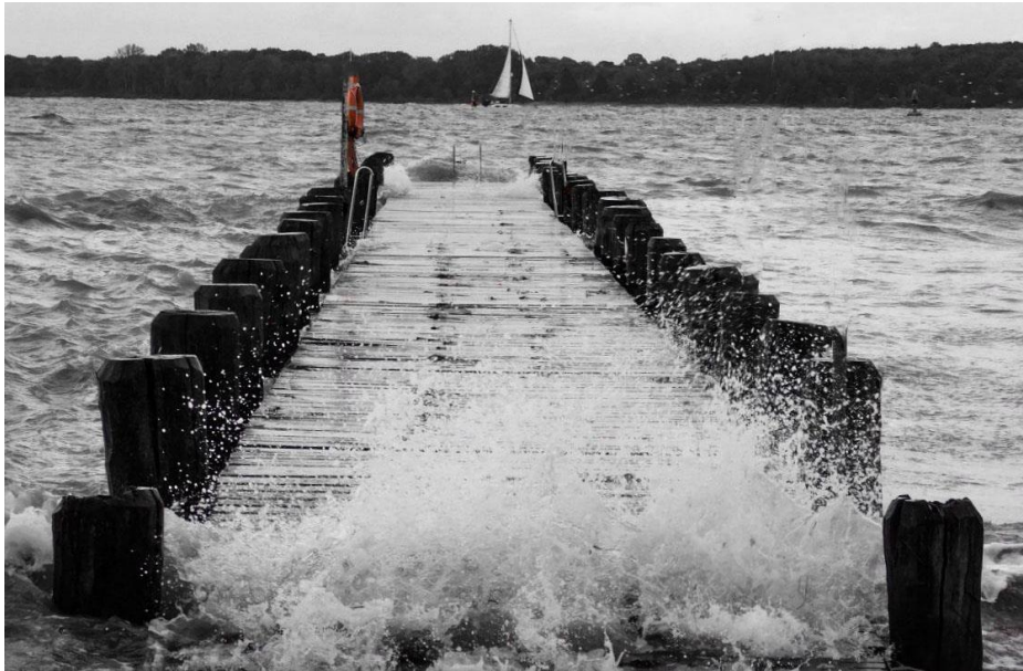
„breakers“, Kategorie: Wind & Wetter

Diese Verwaltungstätigkeit geschieht im Rahmen der Geschäftsbesorgungsverträge zwischen PVZ und den Auftraggebern. Somit ist die PVZ im Sinne der DS-GVO ein Auftragsverarbeiter. Aktuell verwaltet die PVZ Abonnements von über 500 Zeitungen und Zeitschriften (Print, E-Paper) von über 50 deutschen Verlagen.