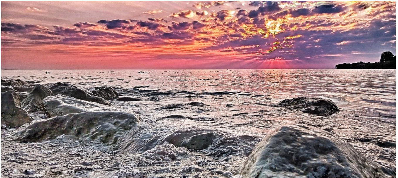
„Feel The Sunrise“, Kategorie: Tag am Meer